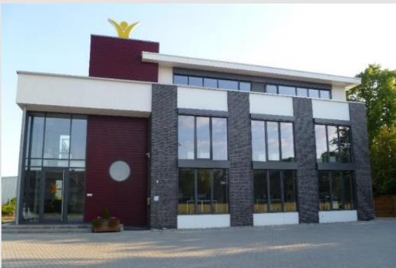
Zentrale in Gronau

Zum aktuellen Zeitpunkt beschäftigen wir ca. 200 Mitarbeiter bei etwa 30 verschiedenen Kunden im gesamten Münsterland sowie im nördlichen Ruhrgebiet. Spezialisiert sind wir auf den gewerblichen Facharbeiterbereich.